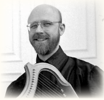
Greensleeves: muziek voor harp en blokfluit