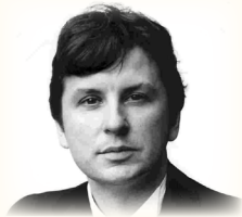
Twee barokke programma's: